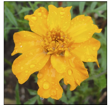
Tagetes, Tagetes erecta , Suzannes enkle orange FS0320