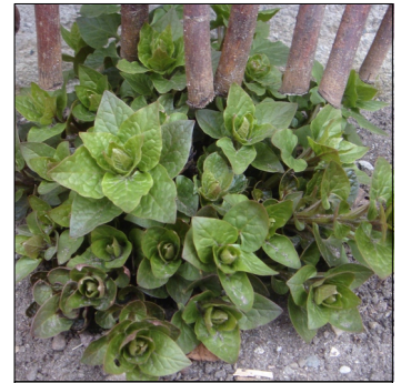
Spinatranke, Hablitzia tamnoides , Spinatranke