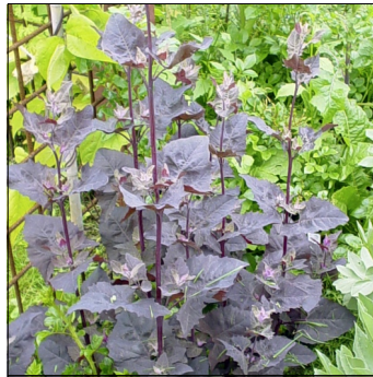
Havemælde, Atriplex hortensis , Rød havemælde FS0040