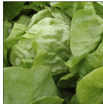
Havesalat, Lactuca sativa , Nisa FS0654 VIR-1832