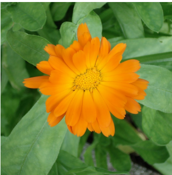
Morgenfrue, Calendula officinalis , Brita FS0624