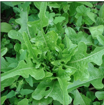
Havesalat, Lactuca sativa , Arap Saçi FS0014