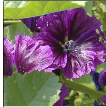
Mauretansk katost, Malva sylvestris , Malva