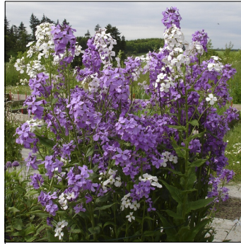
Aftenstjerne, Hesperis matronalis , Aftenstjerne, almindelig FS0558