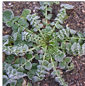
Barbarea verna , Langskulpet vinterkarse FS0059