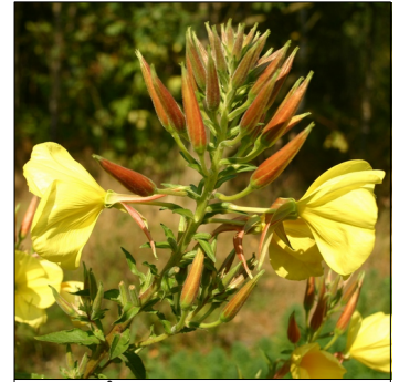
Natlys, toårig, Oenothera biennis , Natlys