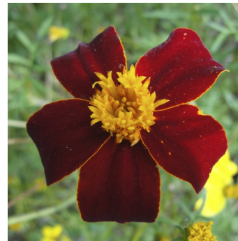
Tagetes, Tagetes erecta , Ildkongen FS0318