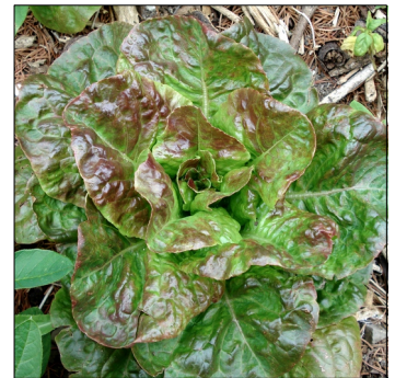
Havesalat, Lactuca sativa , Baquieu FS0564