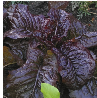
Havesalat, Lactuca sativa , Outredgeous FS0543