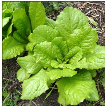
Havesalat, Lactuca sativa , Kasseler Stränk FS0039