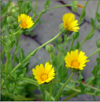
Morgenfrue, ager-, Calendula arvensis , Agermorgenfrue (fra Madeira)