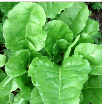
Bladbete, Beta vulgaris , Engelsk Spinat fra Hvidkilde FS 0047