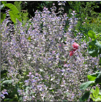
Skarleje, Salvia sclarea , Skarleje FS0389