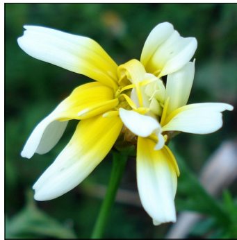
Chrysantemum, Glebionis coronaria , Spiselig Chrysantemum