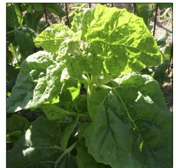
Havemælde, Atriplex hortensis , Havemælde fra Bornholm